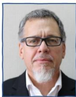
Ricardo LAGOS WEBER